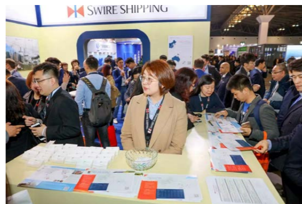
太古轮船展台吸引多名行业人士前来咨询洽谈。

2019 年 3 月，亚洲专业的满足传统重大件、件杂货和项目货运需求的大型展览会——亚洲国际件杂货运输展览会（前身为上海国际件杂货运输展览会）在上海举办。太古轮船有限公司（“太古轮船”）自展会创立伊始，已连续七年参加这一行业盛会，并成为 2019 年展会赞助商。展会期间，公司展位接待了超过 6,000 名专业人士咨询洽谈。同时，公司还于黄浦江举办客户招待晚宴，邀请来自中国、喀里多尼亚和尼日利亚等国家的约 200 位合作伙伴和客户参加。