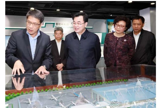
厦门太古行政总裁陈正（左一）向福建省常委、厦门市委书记胡昌升（居中）等领导介绍公司业务。

2019年3月，福建省常委、厦门市委书记胡昌升来到厦门太古飞机工程有限公司（“厦门太古”），实地察看飞机维修业务，询问企业生产经营、行业发展和对政府服务的需求等情况，了解厦门打造全球重要“一站式”航空维修基地成果。多年来，厦门太古在大型维修、客机改装货机以及机舱改装服务等方面，一直保持行业领先地位。