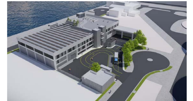
此图为概念设计构想图，或会有所修正及更改。

太古可口可乐宣布一项重要投资，用于香港饮料行业废物的可持续回收。该公司与欧绿保集团(亚洲)有限公司及碧瑶废物处理及回收有限公司成立合资公司，在香港运营一座配备先进技术的塑料废料回收设施。该设施作为香港首个专门用于处理“聚对苯二甲酸乙二醇酯”(PET)和“高密度聚乙烯”(HDPE)的回收设施，将于环保园——位于香港屯门的回收及环境工程中心兴建，预计于2020年第三季度开始投入运作。