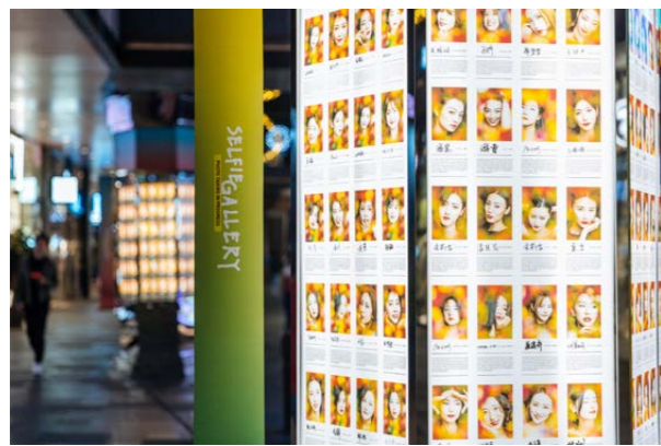
“太美成都 Made in Chengdu”自拍画廊展出海报

2019年4月28日，在成都远洋太古里漫广场，一段以“太美成都 Made in Chengdu”为主题的短片，为成都远洋太古里四周年庆典正式拉开帷幕。至5月11日，由1,001名成都女性参与拍摄的“太美成都 Made in Chengdu”自拍画廊于里巷展出。成都远洋太古里还携手 P1 时尚街拍，及场内数百个国际时尚、美妆、餐饮品牌，为全城消费者献上了一系列精彩纷呈的四周年庆典活动。