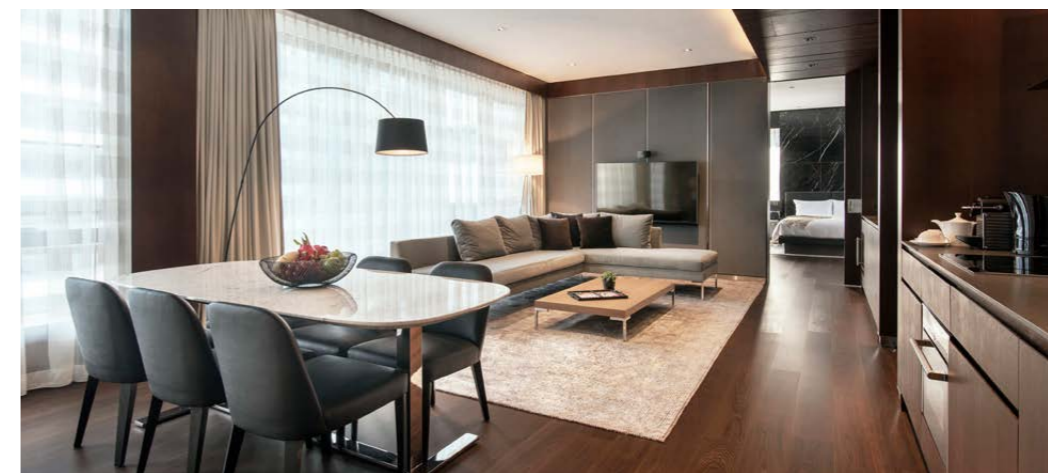
东隅服务式住宅的顶层特色单位

东隅服务式住宅现时更引入东隅酒店的个性化贴身服务。项目内的配套设施及管理服务优质完善，除配备24小时健身室、时尚休憩区和阅读区外，更有景观开阳的露台俯瞰邻近的太古坊社区。住客亦可享用位于东隅酒店的健身房及游泳池，在餐厅 Mr & Mrs Fox、Plat du Jour（海湾街）及东隅酒店全天候餐厅 Feast 及露天天台酒吧 Sugar 享受便捷签单服务。