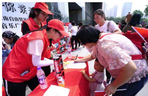
现场观众积极加入“为你读书”公益快闪活动。

2019年5月，海南太古可口可乐饮料有限公司（“海南太古可口可乐”）携手海口音乐广播在海口开展“为你读书”快闪公益活动，吸引了近千人共同参与。活动首先通过歌唱、舞蹈、朗读等方式庆祝中国（海南）自由贸易试验区设立一周年，随后开展“公益捐书，为爱童行”环节，积极倡导大家为贫困山区儿童捐书，共同关注孩子们的健康成长。此次活动共捐助近千本书籍。为表达对捐书者的感谢，海南太古可口可乐为每一位爱心捐赠者赠送了精美的可口可乐定制礼品，希望更多人一起传递对留守儿童的爱，为他们营造一个丰富多彩的阅读环境。