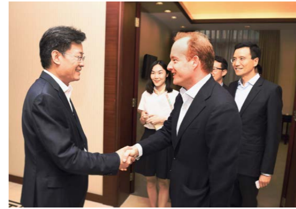
香港太古集团主席施铭伦（右）拜会珠海市委书记郭永航（左）。

2019 年 5 月 27 至 29 日，香港太古集团主席施铭伦一行前往粤港澳大湾区所在城市考察，包括深圳、东莞、广州、佛山、中山、珠海以及澳门，旨在全面深入了解大湾区各方面发展，尤其是科技创新、消费力以及基建领域。考察期间，施铭伦主席分别与珠海市委书记郭永航和深圳市委常委杨洪会谈，探讨太古集团在珠海及深圳的投资发展机会。