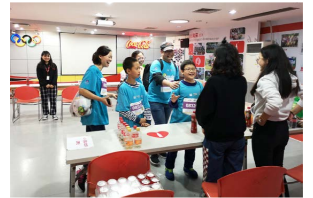
“穿越城市·世界巡回赛”厦门站参赛者打卡现场

“穿越城市·世界巡回赛”作为“世界城市日”的系列活动之一，是全方位展示城市发展，挖掘城市内涵，让更多的市民积极参与城市共建共享的公益性赛事；“悦动湖里·青春活力挑战赛”是厦门市湖里区为庆祝中华人民共和国成立70周年、纪念五四运动100周年举办的大型体育赛事。