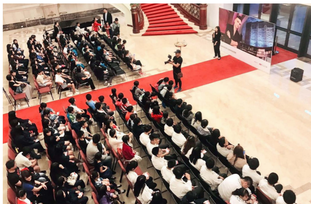
音乐会开场前，中小学生学习及其他嘉宾参与管风琴介绍会。

的兴趣。太古汽车集团不仅以优惠票价鼓励青少年走进音乐厅接受艺术的洗礼，更是结合旗下各品牌的资源一同参与此次青少年计划，例如有200名偏远地区中小学生学习搭乘沃尔沃巴士来参加此次活动，并在音乐会之前聆听音乐博士解说管风琴的百年壮丽之美。