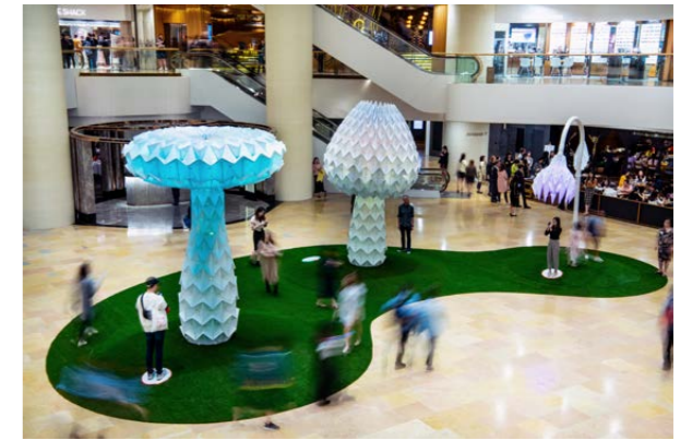
LUMENous GARDEN 是太古广场购物中心的一个巨型折纸互动艺术装置，能感应游客的活动而改变形态和颜色。

2019年3月至4月，太古地产艺术月2019多个节目于香港太古广场、星街小区及太古坊 ArtisTree 登场，精心挑选多个由国际享负盛名艺术家打造的精彩节目，包括旧金山艺术团队 FoldHaus 首次将“火人祭” (Burning Man) 的艺术装置带到香港，更有纽约艺术家 Derick Melander、法国街头艺术家 L'Atlas、奥地利艺术家 Willi Dorner 的精心制作。今年艺术月标志着太古地产与巴塞尔艺术展香港展会的合作踏入第七年，在会场内特设的贵宾室设计由 Paul Cockledge 操刀，乃他在香港的首个作品。太古地产与伦敦皇家艺术学院合作，在贵宾室举行一系列启迪思维的讲座及活动。