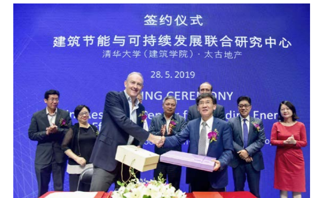
太古地产行政总裁白德利（左）与中科院院士、清华大学副校长薛其坤教授（右）在签约仪式上互赠礼品。

未来三年，中心将继续以建筑节能和可持续发展为首要任务，进一步推进相关研究和实践，利用机器学习等人工智能技术拓展数字化应用实践，为共同应对气候变化、实现社会节能减排目标做出贡献。