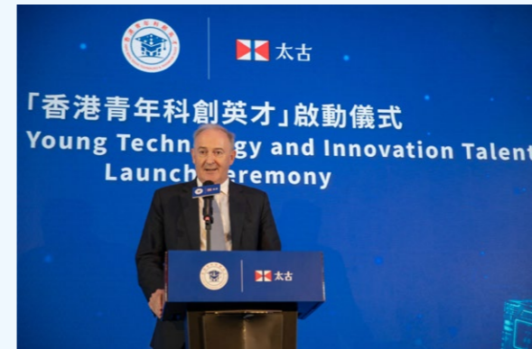
香港太古集团主席白德利在启动仪式上致欢迎辞。