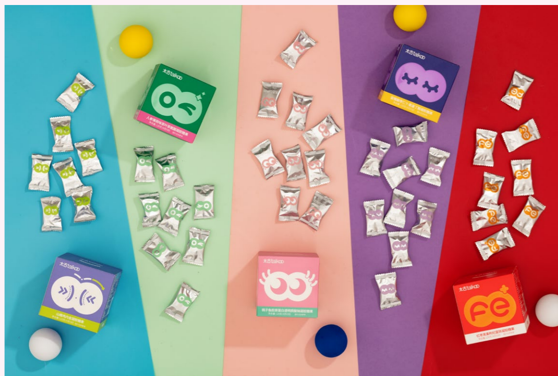
太古糖草本软糖系列产品

蓝莓酸枣仁软糖、人参薄荷味茶叶软糖、山楂鸡内金软糖、桃子鱼胶原蛋白软糖、红枣黑果枸杞软糖……“全民养生”热潮下，太古糖今年6月份刚刚推出的草本软糖系列包含五款产品，针对日常消费者睡眠、提神、促消化、美肌和补铁需求，美味又养生，仅凭名称便俘获一众年轻养生人士的心。时尚现代的包装设计、丰富多元的口味和功能选择，不仅刷新了不少消费者对于太古糖“调味品牌”的印象，更折射出太古糖对于消费者追求健康理念与美好生活的精准洞察。