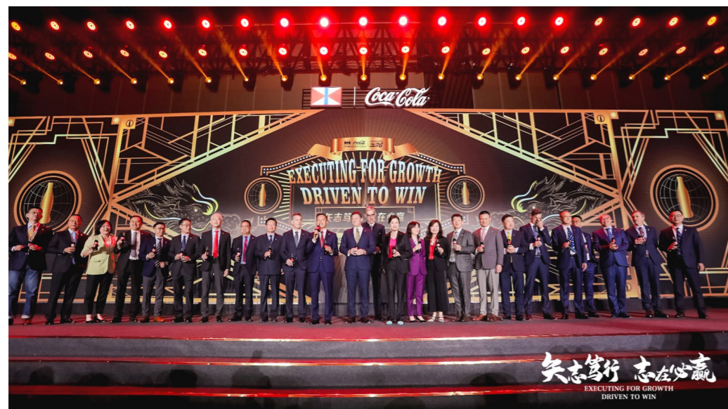
可口可乐中国高层管理人员、太古可口可乐管理层与中国内地13家装瓶厂代表在年会上共享荣耀时刻。

代表则分享了其在销售和营销、数字化和人力资源管理等关键领域的最佳实践。年会颁奖晚宴上，浙江太古可口可乐荣获“可口可乐中国2022年最佳装瓶厂大奖”以及“太古可口可乐2022年度装瓶厂金奖”。