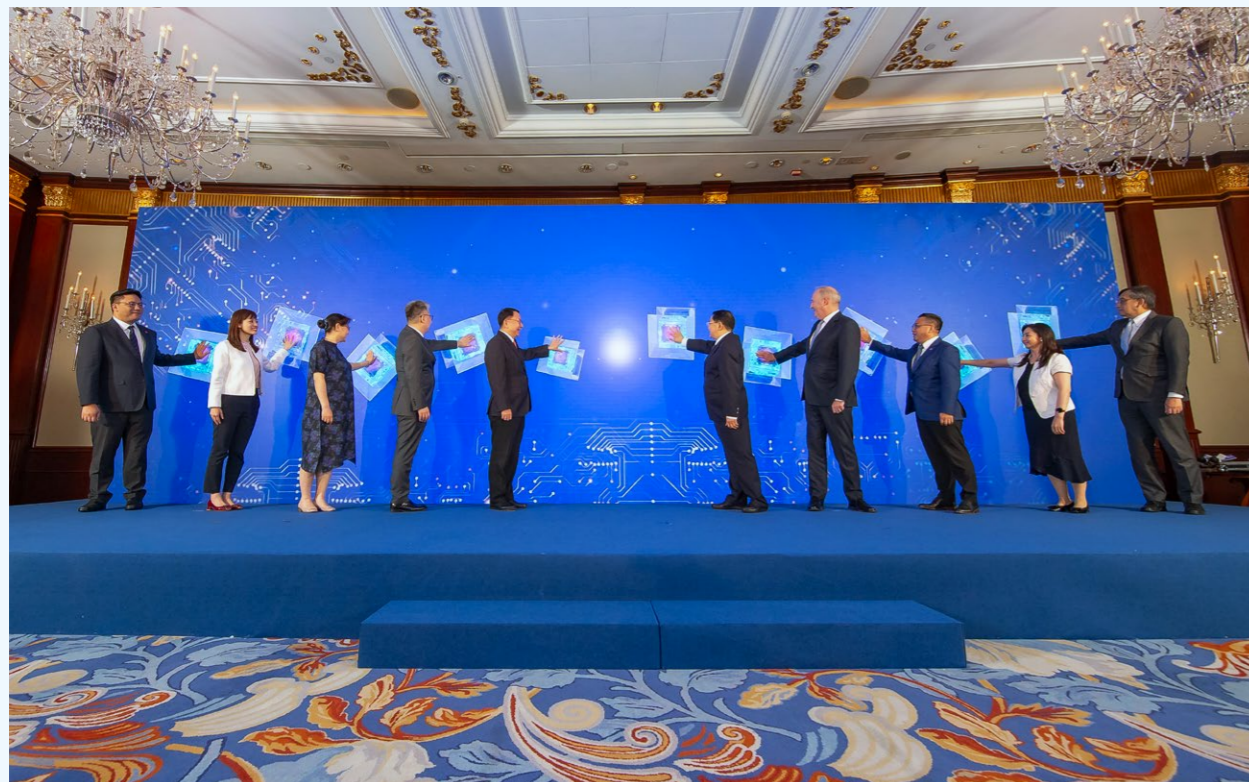
“香港青年科创英才”计划正式启动。

人员交流与科创发展“比翼齐飞”，是太古集团“香港青年科创英才”计划的重要特色。这根植于其内核：聚焦科技领域青年人才培养，鼓励在香港成长、品学兼优且有志在科技创新领域发展的香港青年，到内地高校主修科技相关专业。