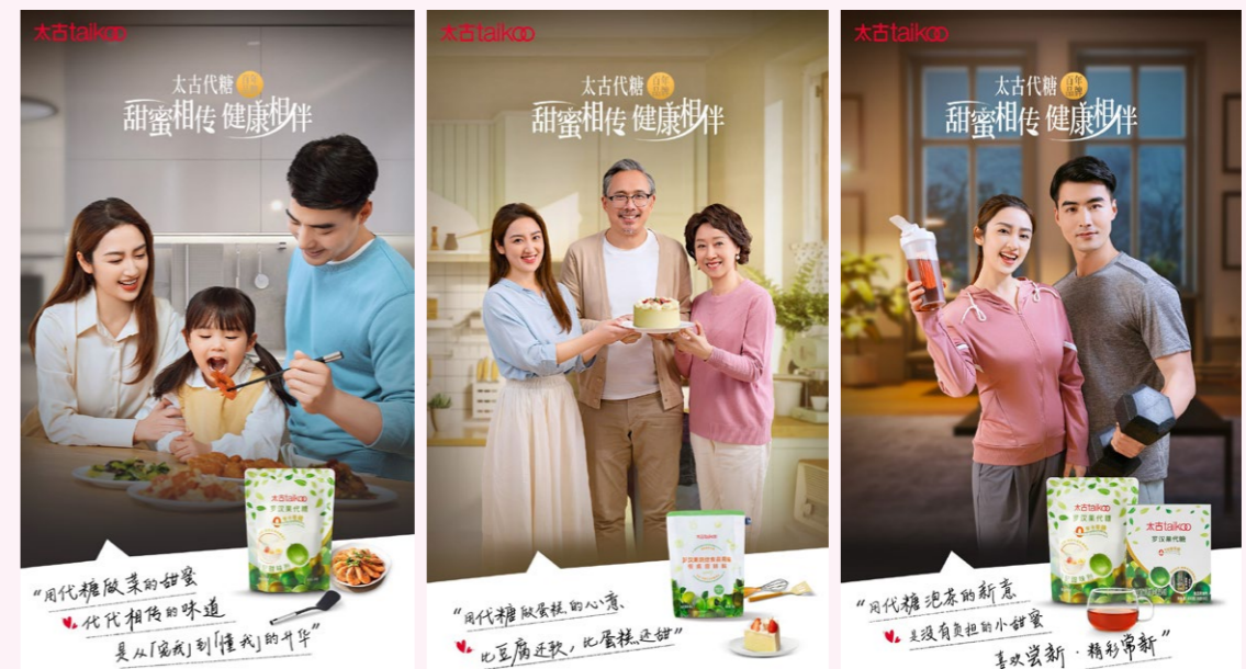
太古糖为代糖系列产品发起首个线上平台全年推广计划#甜蜜相传，健康相伴#。

因传承历久，因创造弥新。中国市场和消费者消费观念的转变成为太古糖持续发展与探索带来新机遇，太古糖将继续以消费者的需求为导向，以专业和严谨的工匠精神，悉心传递“舌尖”上的甜蜜，服务人们的美好生活。