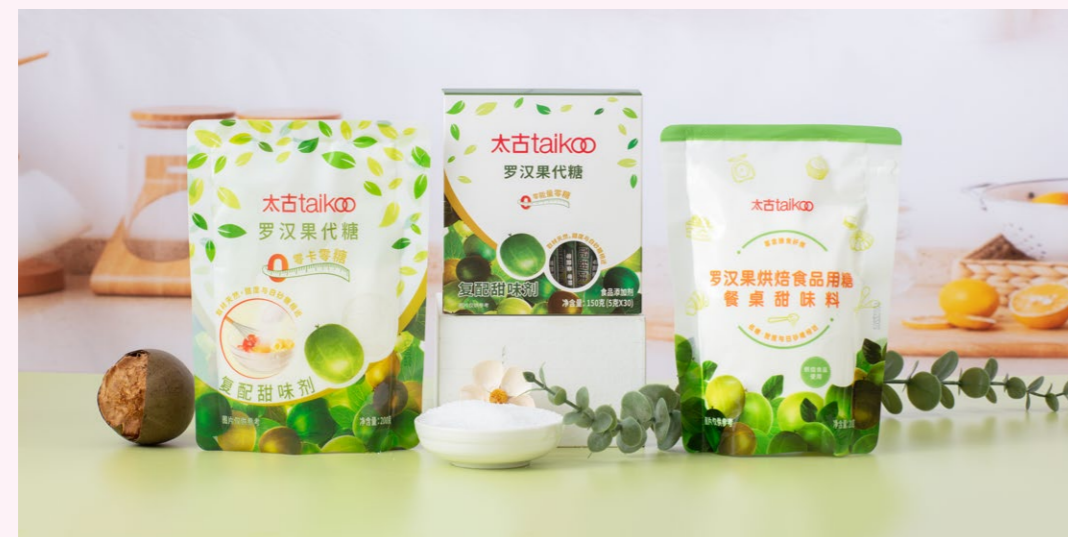
太古糖罗汉果代糖系列产品

太古糖在大中华区已耕耘超过百年。依托于广州、成都的两所糖产品包装厂房，太古糖目前在中国内地的经销网络遍及逾120座城市，服务亿万消费者。在消费群体迭代、新中产引领的消费升级背景下，面向未来，进一步满足年轻化、品质化的市场需求，实现客户群体多元化，是太古糖的关键发展方向。