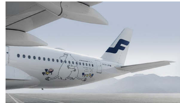
芬兰航空 100 周年纪念涂装

2023年5月，港机集团旗下港机（香港）宣布与芬兰航空延长空中客车 A330 及 A350 机队的基地维修服务至 2026 年。自 2008 年双方开始合作，港机（香港）已为芬兰航空提供超过 100 架次飞机维修服务。