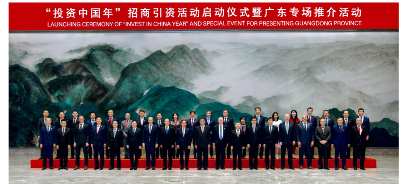
香港太古集团主席白德利（前排右五）与出席“投资中国年”招商引资活动启动仪式的领导和嘉宾合影。

随后，白德利主席赴海南出席博鳌亚洲论坛 2023 年年会，国务院总理李强出席年会开幕式。在海南期间，白德利主席会见了三亚市委常委、常务副市长盛勇军，就太古集团与三亚市加强合作进行交流。