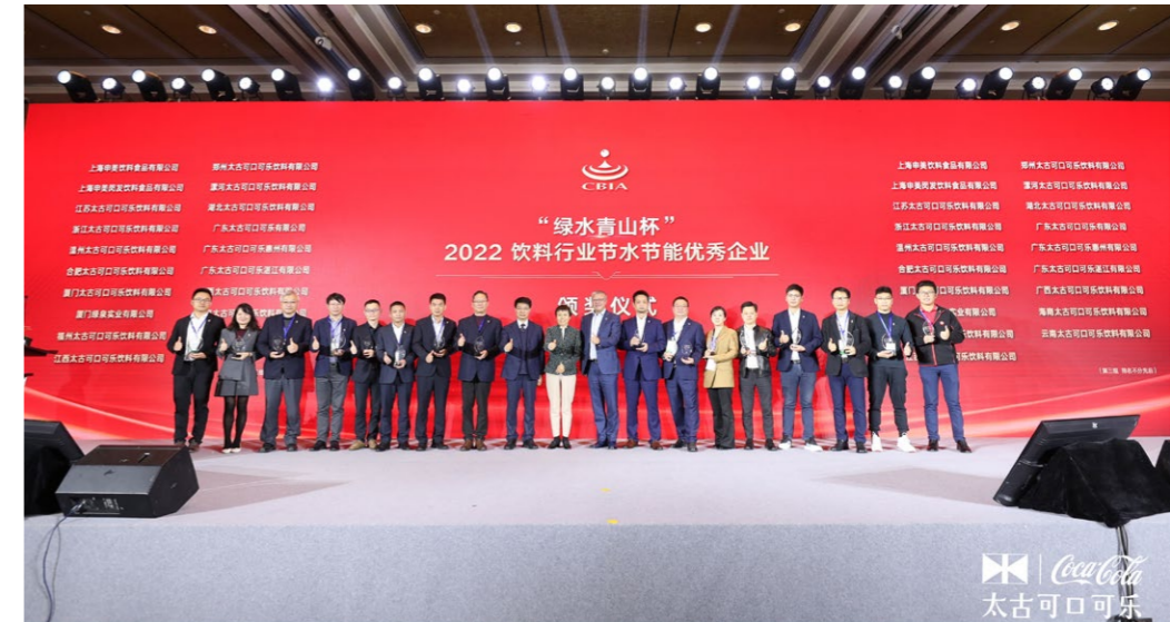
太古可口可乐中国区所有工厂荣获2022“绿水青山杯”中国饮料行业节能优秀企业称号，16家工厂获评“节水优秀企业”。

基于太古可口可乐对行业可持续发展的贡献，以及在“rPET资源循环使用”相关研究项目中的努力，太古可口可乐获得中国饮料工业协会颁发的公益研究贡献奖。